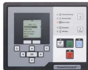
Display/ pannello di controllo PowerCommand 1.2

Nota: per ulteriori informazioni sul sistema di controllo, fare riferimento alla documentazione del prodotto PC1.2.